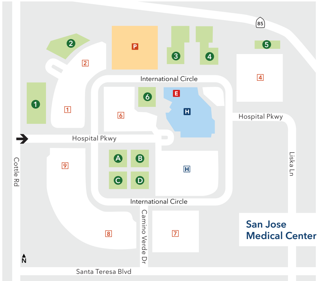
San Jose Medical Center